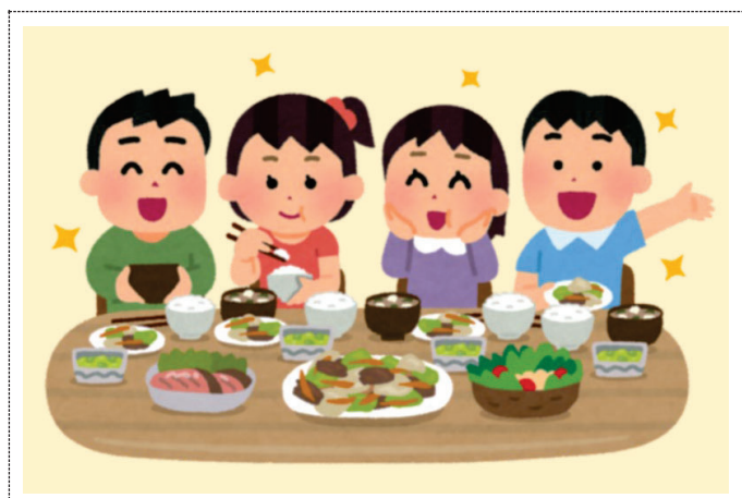
子どもたちのスペース（その他フードパントリーの様子が見えるもの）